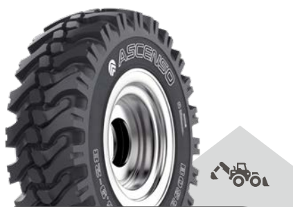
BOSS [R-4] TL

12.5/80 - 18 14 PR 18.4 - 26 14 PR * 16.9 - 28 12 PR