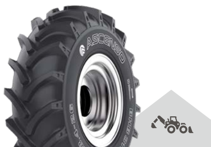
BHB 311 [R-1] TL

12.5/80 - 18 12 PR | 14 PR 400/70 - 20 16 PR * 14.9 - 24 12 PR * 16.9 - 24 12 PR 17.5L - 24 10 PR 18.4 - 24 12 PR 18.4 - 26 12 PR | 14 PR 16.9 - 28 12 PR 16.9 - 30 12 PR