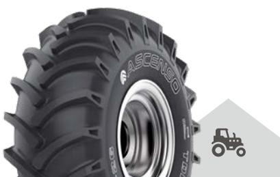
TDB 123 [R-1] TT