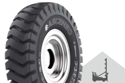
PEB 720 (E-3) TL

Reach Stecker a přístavní manipulační pneumatiky