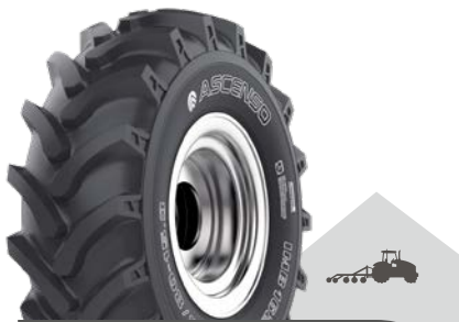
IMB 162 [R-1] TL

Robustní pneumatika určená pro malou stavební techniku