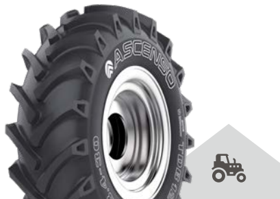
TDB 120 [R-1] TT

Univerzální dezén s vysokou trakcí určený pro široké použití