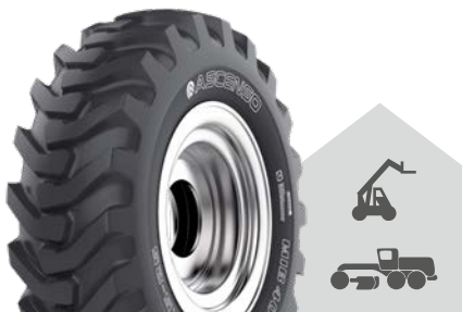
MIB 405 [L-2/G-2] TL

Multifunkční použití na kolových nakladačích a menší stavební technice