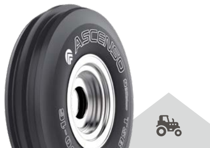
TSB 110 [F2] TT

Univerzální použití na předních nápravách snižuje poškození plodin. Komfortní řízení a vedení.