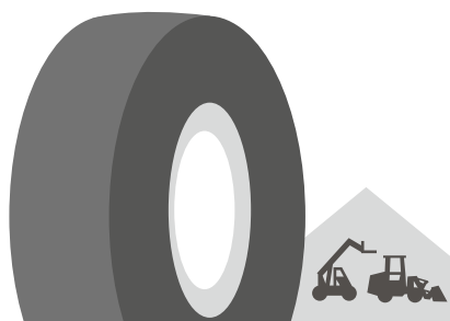
MIB 407 [R-4] TL

Univerzální pneu pro kolové nakladače, traktorbagry a manipulátory