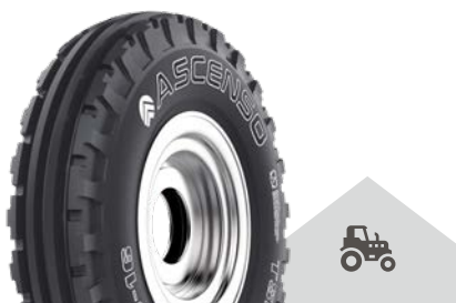
TSB 111 [F2] TT