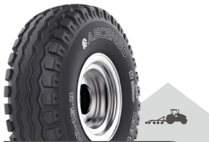
IMB 160 [I-2] TL

Minimalizuje ztuhnutí půdy Zesílená kostra pneumatiky Osvědčený univerzální dezén