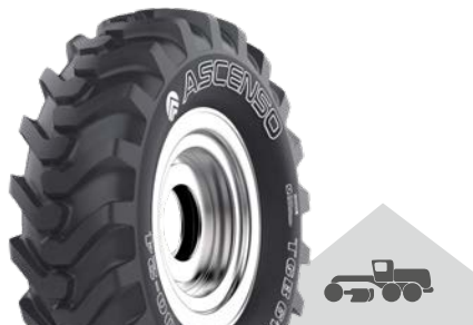
TGB 610 [G-2] TL

13.00 - 24 12 PR | 16 PR 14.00 - 24 12 PR | 16 PR