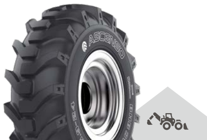
BHB 310 [R-4] TL

Univerzální pneumatika určená pro použití na kolových bagrech. Extra silná nylonová kostra