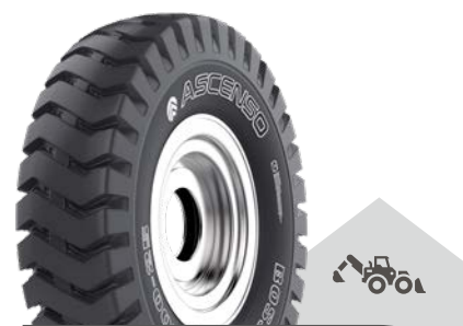
BOSS [E-3] TT

12.5/80 - 18 14 PR 18.4 - 26 14 PR * 16.9 - 28 12 PR