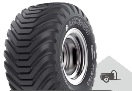
FTB 190 [I-3]

Flotační dezén optimalizující tlak na půdu. Vynikající trakce, samočistící schopnosti