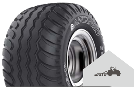
IMB 161 [I-2] TL

10.0/75 - 15.3 10 PR | 14 PR 11.5/80 - 15.3 10 PR | 14 PR | 16 PR 12.5/80 - 15.3 14 PR | 18 PR 12.5/80 - 18 16 PR 13.0/65 - 18 16 PR 15.0/70 - 18 16 PR