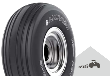
IMB 163 [I-1] TL

11.2 - 24 6 PR 14.9 - 24 8 PR 11.2 - 38 6 PR