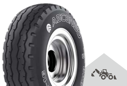
BHB 313 [F-3] TL