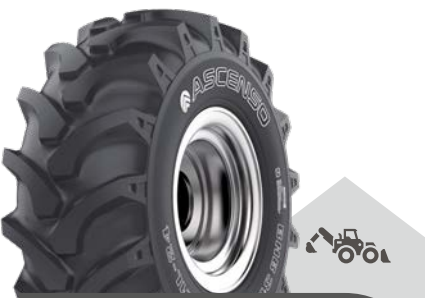
BHB 312 [R-4] TL