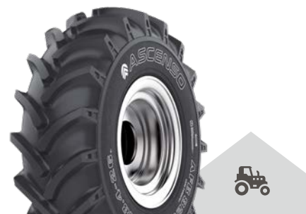
AFB 820 [R-1] TL

Záběrové pneumatiky pro použití na pole a do lesa