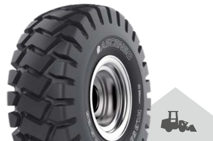
WLB 550 [L-3] TL

Univerzální dezén určený pro kolové nakladače a dozery