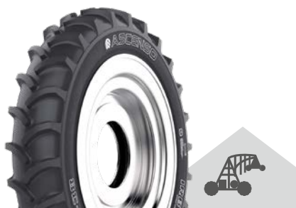
IRB 260 [I-2] TT

10.0/75 - 15.3 10 PR | 14 PR | 18 PR 11.5/80 - 15.3 12 PR | 14 PR 19.0/45 - 17 10 PR