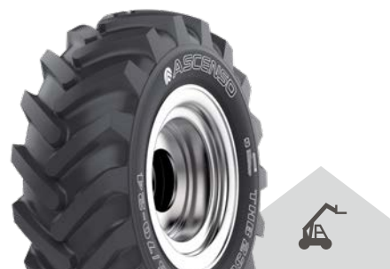
THB 230 [R-1] TL

Pneu pro teleskopické a kompaktní manipulátory